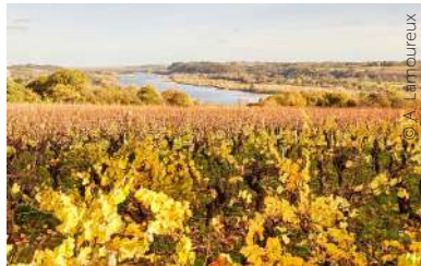
Domaine des Genaudières - Le Cellier et point de vue depuis le lieu-dit St-Méen (Le Cellier)