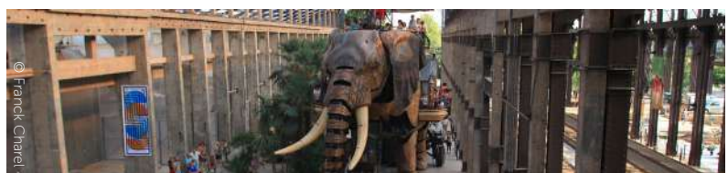
Les machines de l'île - Nantes

Die Stadt Nantes liegt 45 Minuten mit dem Auto von La Baule entfernt. Die Loire, der meist besuchte Fluss Europas, durchquert Nantes und erschafft somit die Flussinsel von Nantes. Die bevölkerungsreichste Stadt der Region bietet Reisenden eine Reihe von Besuchen und Ausflügen an. Der Reiseort Nantes bietet ein einzigartiges kulturelles Programm. Das Nachtleben ist sehr intensiv. Das Feiern kommt dank der Vielfalt an Bars und Nachtclubs nicht zu kurz – es gibt etwas für jeden Geschmack! Auch die Shopping-Liebhaber kommen voll auf ihre Kosten in der Innenstadt von Nantes und den Einkaufszentren von Atlantis und Beaulieu!