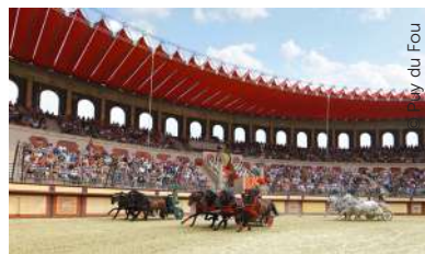
Grand Parc du Puy du Fou - Le Signe du Triomphe

Diese Straße bietet Besuchern die beste Möglichkeit, diese Weinregion zu entdecken. Die Reiseroute ermöglicht es, das Kulturerbe und die Einzigartigkeit der Weinbaugebiete kennenzulernen. Mit dem Auto, zu Fuß oder mit dem Fahrrad, mit dem Boot entlang der Loire, diese vielen Möglichkeiten stehen Ihnen zur Verfügung, um diese Weinregion Frankreichs zu entdecken. Sie können die Schönheit des in Europa am meisten besuchten Flusses dank der speziell ausgestatteten Wege genießen!