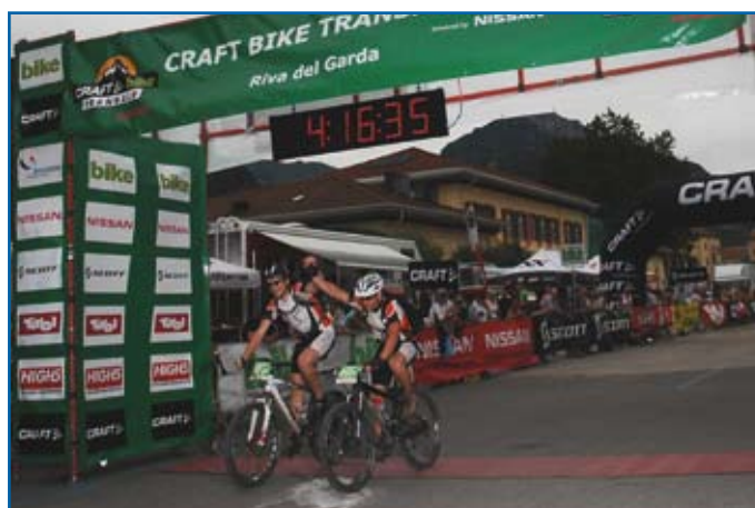
Das PHAST Racing Team bei der Ankunft in Riva del Garda