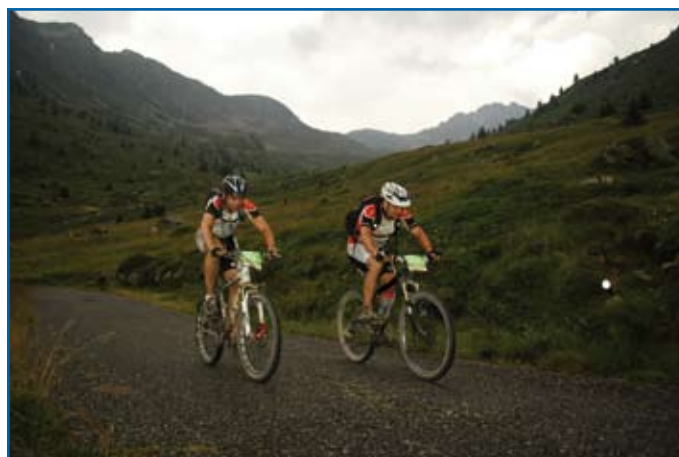
Gemeinsame Anstrengung bei schlechtem Wetter

Der Tag nach der Königsetappe ist meist der schwerste. Schon am ersten Berg fuhren wir am Limit. Bei der Abfahrt von der Passhöhe bei 2400 m über Null traf es auch mich: Eine kurze Unaufmerksamkeit, ein unbedachter Fahrfehler und schon kam ich ins Straucheln und schlug bei 30 km/h in ein Geröllfeld ein. Ich rappelte mich auf, zählte die Knochen und wollte wieder auf das Rad steigen um weiterzufahren, was aber nicht funktionierte. Die Kette sprang ständig runter. Das Schaltwerk war gebrochen. Zum Glück hatten wir ja ein Erst-Hilfe-Pack dabei, so dass wir das Rad rasch notdürftig verarzten konnten: Das Schaltwerk flickten wir mit Hilfe zweier Pflaster und