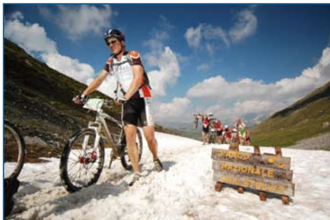
Schneewächten im Stifser Nationalpark

Von der Startplatzvergabe bis zum Start des Rennens war mehr als ein halbes Jahr Zeit. Dies verleitet, nicht sofort mit dem Training beginnen. Im April legten wir daher ein einwöchiges Trainingslager ein und konnten so unsere Form auch erheblich verbessern. Trotzdem mussten wir einige Extraeinheiten fahren, um die Strapazen unbeschadet überstehen zu können.